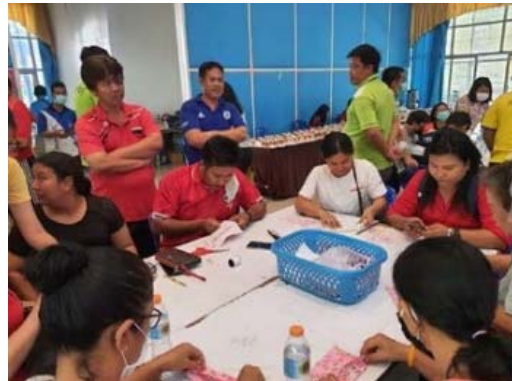
๔) กิจกรรมจัดซื้อเวชภัณฑ์ป้องกันควบคุม การแพร่ การระงับ การระบาดของโรคติดเชื้อไวรัสโคโรนา ๒๐๑๙ (COVID - 2019)