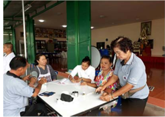
๒) กิจกรรมส่งเสริมการจัดการบ้านเรือนเป็นระเบียบเรียบร้อย สะอาด ถูกสุขลักษณะ