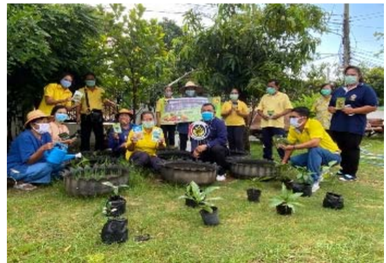
๒) กิจกรรมการพัฒนาพื้นที่ต้นแบบการพัฒนาคุณภาพชีวิตตามหลักทฤษฎีใหม่ประยุกต์สู่ “โคก หนอง นาโมเดล”