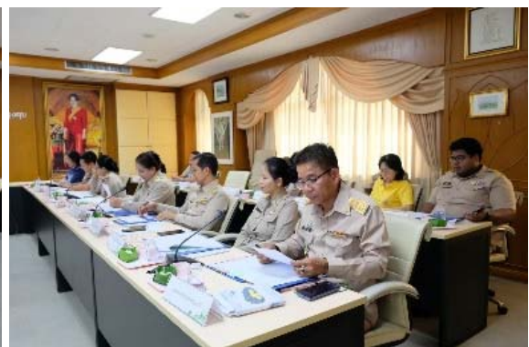
ภาพการประชุมซักซ้อมหน่วยงานที่จะร่วมโครงการพัฒนาคุณภาพชีวิตของประชาชนจังหวัดปทุมธานี