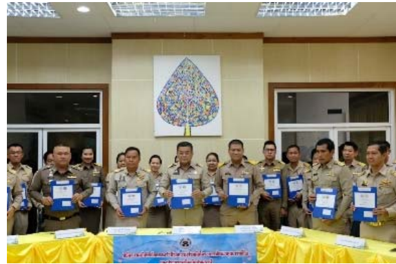
ภาพการลงนามบันทึกข้อตกลงว่าด้วยความร่วมมือ (MOU) โครงการพัฒนาคุณภาพชีวิตของประชาชนจังหวัดปทุมธานี

๖. หน่วยงานที่เข้าร่วมโครงการพัฒนาคุณภาพชีวิตของประชาชนจังหวัดปทุมธานี แจ้างแผนการพัฒนาคุณภาพชีวิตของประชาชนตามภารกิจของหน่วยงาน ให้สำนักงานพัฒนาชุมชนจังหวัดปทุมธานีทราบ